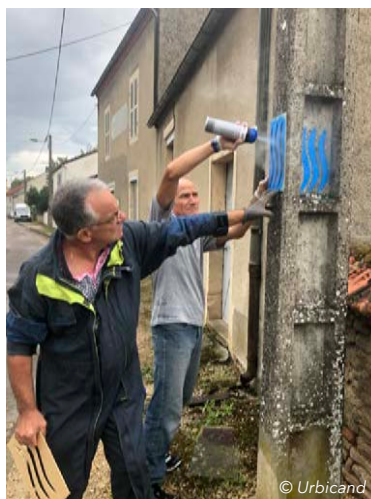
Pochoirs signalétiques appliqués sur le parcours avec le CMS