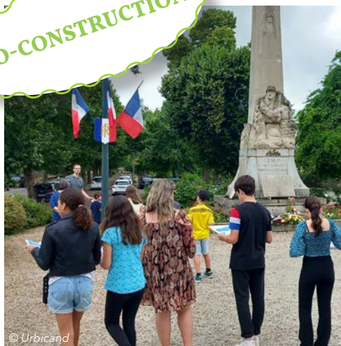
Tracé du parcours en réflexion avec le CMJ