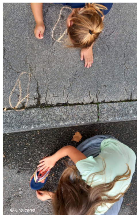
Ateliers ludiques pour tous publics