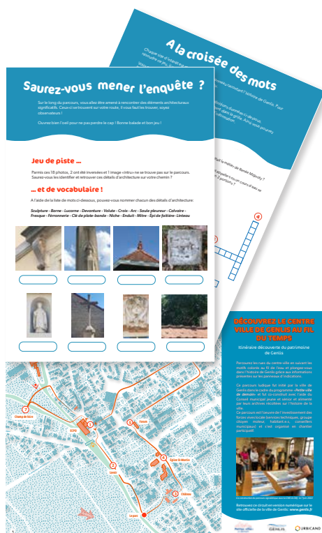
Création de boîte à indices dissimulées sur le parcours et de livrets de jeux pour découvrir l'histoire de Genlis en s'amusant.