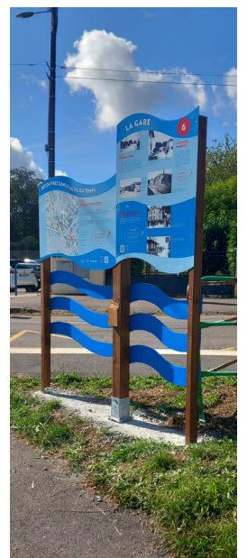
Supports physiques installés dans la commune (design, graphisme, impression)