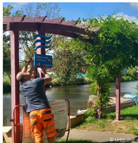
Réalisation du gros œuvre par les services municipaux de la ville