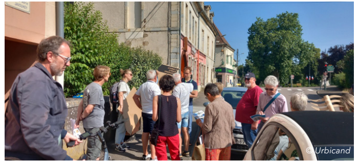
Concertation et co-construction avec le groupe citoyen CMS et le groupe CMJ tout au long de la mission